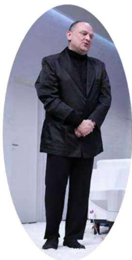
Orgon, a családfő