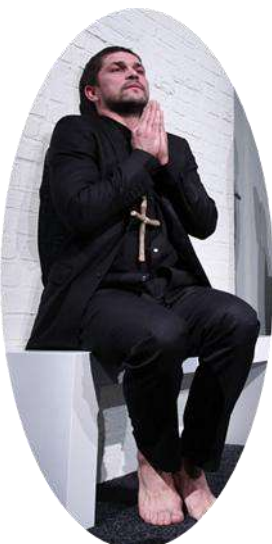
Orgon új bizalmas barátja, házuk új lakója