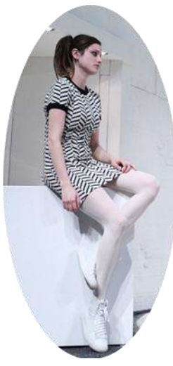
Orgon lánya, Mariane