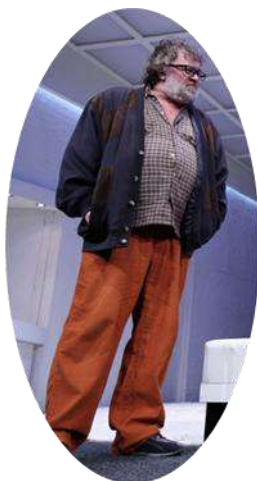
Orgon sógora, Elmira bátyja