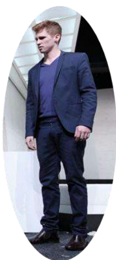
Orgon fia, Damis