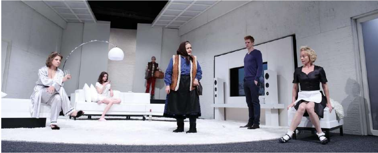
Orgon lakása és családja

Néha elég egy figyelmes pillantást vetni az emberekre és az otthonukra, és máris egészen sok mindent megtudunk, vagy legalábbis megsejtünk róluk.